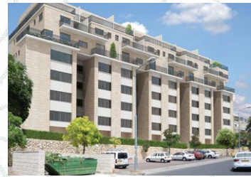
דהומי 10 - 25 יח"ד

חברתנו מעמידה ליווי פיננסי מלא לכל פרויקט, ובנק מהמובילים בישראל מלווה אותנו. הפרויקטים שלנו מנוהלים בשיטת "משק סגור" אשר מבטיח שלא יהיה קשר פיננסי בין פרויקטים, דבר המעניק שקט נפשי וביטחון לדיירים.