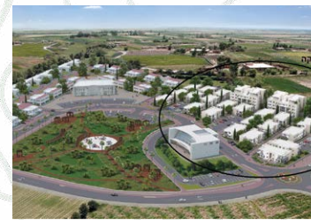
אלומה הירוקה - 130 יח"ד