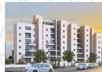
ים סוף 5 - 16 יח"ד