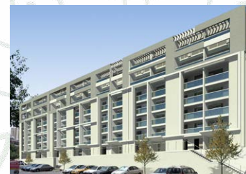
בר יוחאי 18 - 42 יח"ד