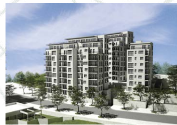
גילה הירוקה - 120 יח"ד