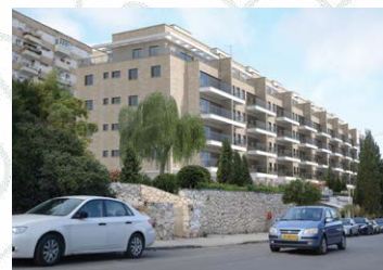
בוליביה 4 - 40 יח"ד