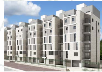
דרך חברון 150 - 81 יח"ד