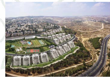
רמות הירוקה - 153 יח"ד