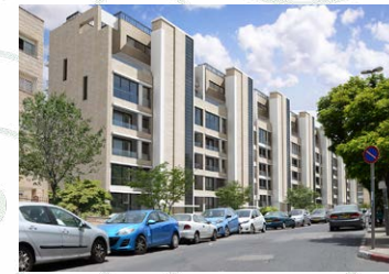
רבקה 22 - 28 יח"ד